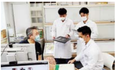
脳神経外科で神経学的観察の見学

3月19日(木)羽咋市消防の救急隊員実習生を4名受け入れました。外来処置室や救急室、手術室などで見学、身体観察をおこないました。