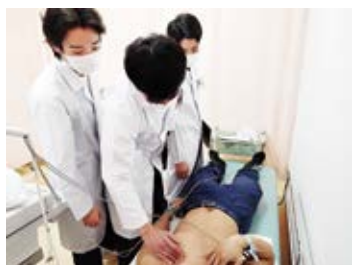
心電図室で12誘導心電図の取り方と見方の見学