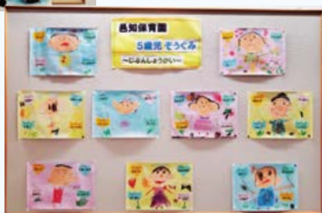
テーマ じぶんしょうかい